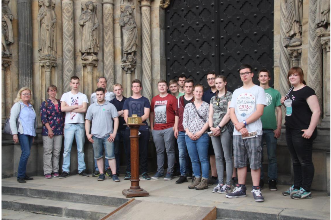
Gruppenfoto vorm Freiburger Dom