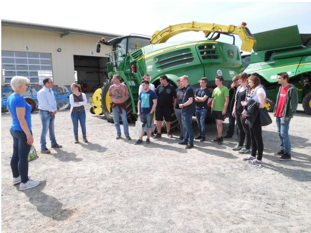
Besuch im LVD Gerichshain